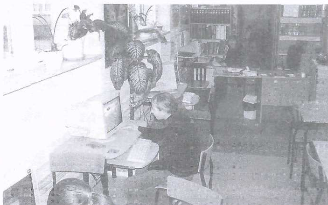
Uczniowie chętnie korzystają z czytelnii multimedialnej mieszczącej się w bibliotece szkolnej