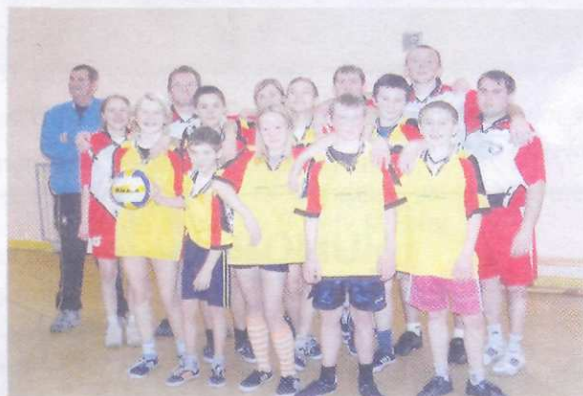
Na zdjęciu reprezentacje SP Radoszyce i UG Radoszyce

W listopadzie b.r. w Szkole Podstawowej w Radoszycach zakończył się międzyklasowy turniej piłki siatkowej. Zwycięzcą okazała się klasa 6 c.