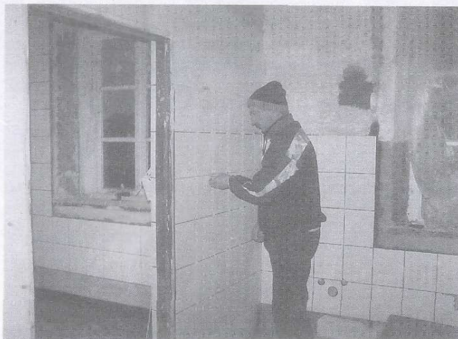
Remont kuchni i zaplecza w remizie trwa

W miesiącu listopadzie rozpoczęte zostały prace remontowe w remizie w Radoszycach.