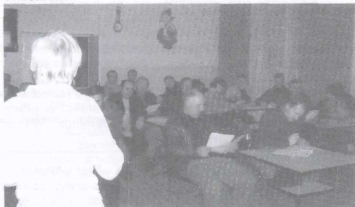
Spotkanie w SP Grodzisku cieszyło się dużym zainteresowaniem

Ogólnym celem projektu jest rozwój i promocja Gminy Radoszyce. Zakłada on stworzenie Stowarzyszenia pod nazwą Lokalna Grupa Działania, oraz Zintegrowaną Strategię Rozwoju Obszarów Wiejskich. Przygotowane zostały ankiety, badania socjologiczne i spotkania z lokalną społecznością w celu określenia kierunków rozwoju naszej gminy. Zorganizowano 10 spotkań w poszczególnych sołectwach.