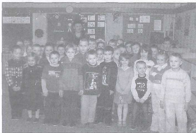
Przedszkolaki udzielały odpowiedzi szybko i chętnie

W związku ze zbliżającymi się Świątami Bożego Narodzenia, postanowiliśmy odwiedzić najmłodszych mieszkańców naszej gminy - przedszkolaków z Radoszyc - i zadać im kilka pytań: