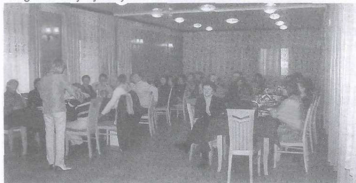
Konferencja inauguracyjna w Warszawie połączona ze szkoleniem -na zdj. przedstawiciele gminy Radoszyce

W dniach 16 – 17 listopada w Warszawie odbyła się konferencja inauguracyjna Programu LEADER + dla Gminy Radoszyce. Wzięła w niej udział 40 osobowa reprezentacja Gminy, która uczestniczyła również w Targach Turystycznych Adrenalina 2005.